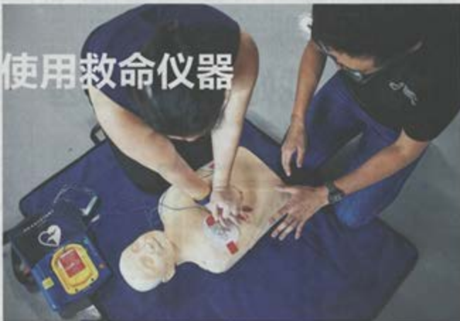
飞利浦与新加坡心脏基金会合作推出免费课程，教人心肺复苏术以及如何利用飞利浦制造的自动心肺复苏器。

新加坡心脏基金会总裁以洪说：“我们只希望看到红十字会的CPR和AED的课程，以帮助我们提高我们的心脏骤停事件的存活率。”